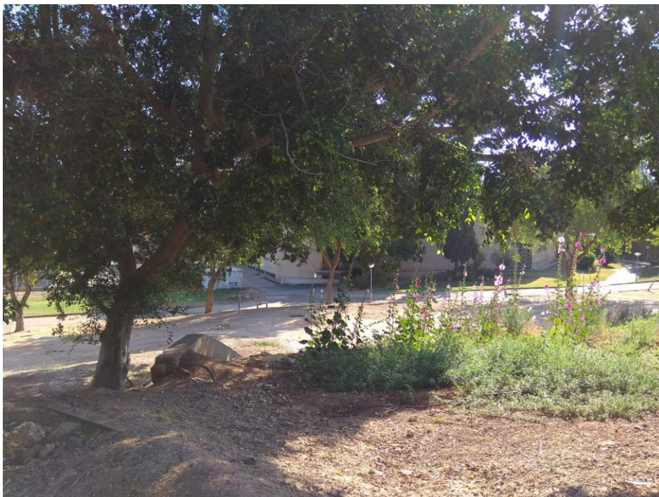
האתר המוצע לגינת הידידות של הקיבוץ ומשפחת אלעזי