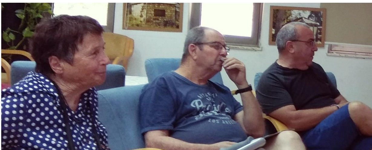
בדיון על ערבות הדדית